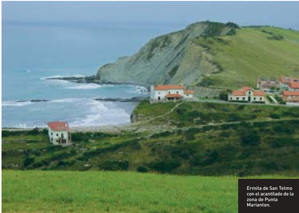
Ermita de San Telmo con el acantilado de la zona de Punta Marianton.